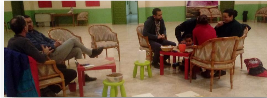
Imágenes Charlando con la Oficina de la Reserva de la Biosfera.