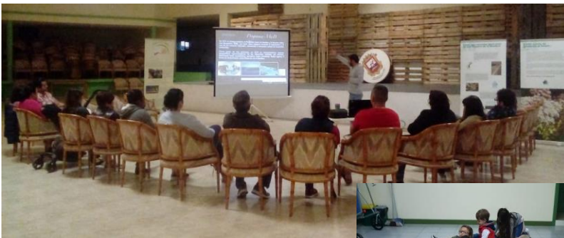
IMAGEN DEL FORO “CHARLANDO CON LA ORBL”