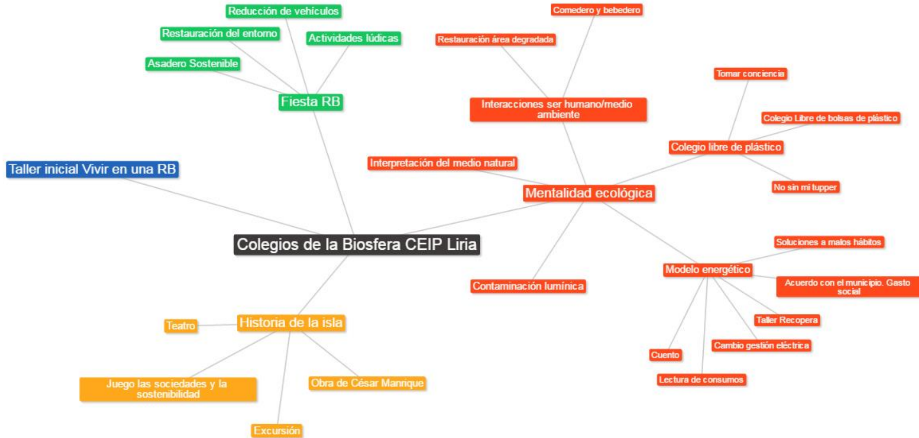
Esquema de la propuesta del Plan de Acción presentado.