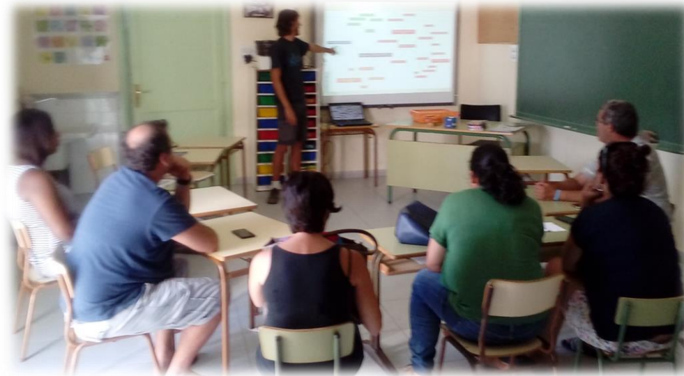
Momento de la reunión del 13 de septiembre en el CEIP Liria